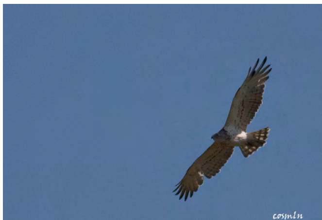
Фиг.5 Орел змияр ( Circaetus gallicus )