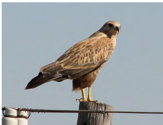
Фиг. Белоопашат мишелов