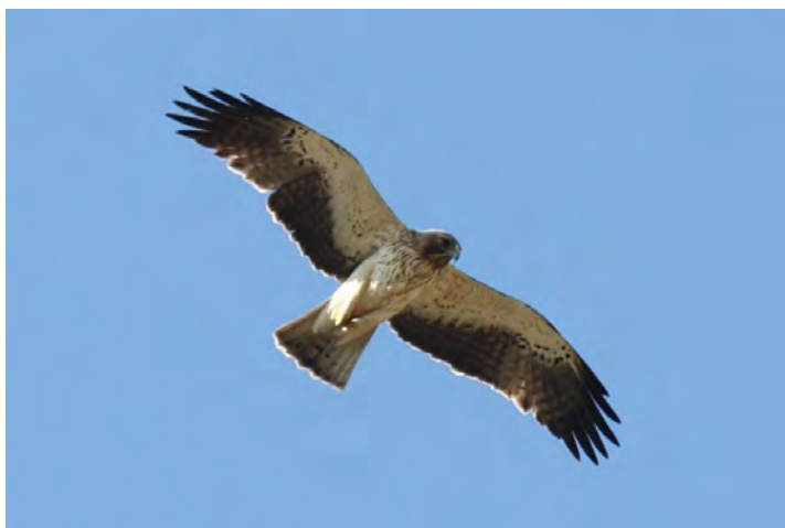
Фиг. 6 Малък орел ( Hieraetus pennatus ) – светла фаза.