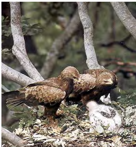
Фиг.4 Малък креслив орел ( Aquila pomarina ) – родители в гнездо с малко.