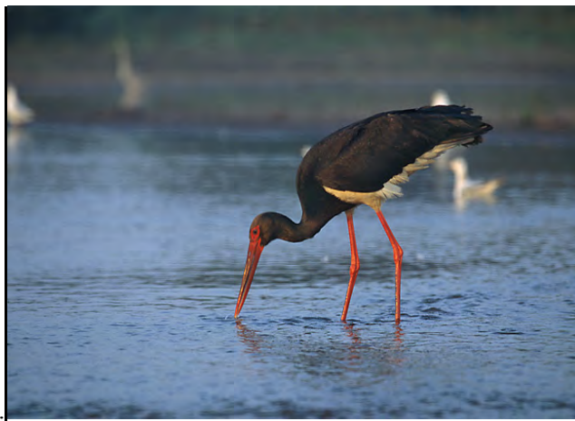
Фиг. 2 Черен щъркел ( Ciconia nigra )