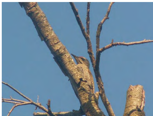
Фиг. Сив кълвач ( Picus canus )

На територията на ДЛС “Черни Лом” гнезди в отдели 33; 57; 71б,е,з; 74а,е,ж,з,л; 76; 77а,б,д-ж; 91; 95; 133д; 192б-з; 197а-л,н-с; 200; 234в,е-и,м; 335