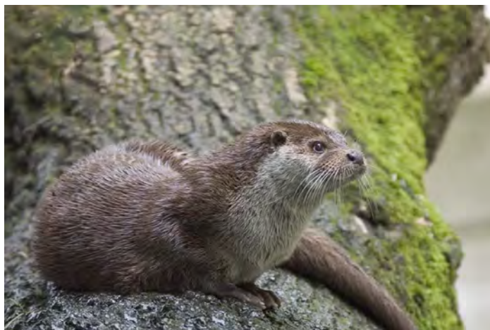
Фиг.1 Видра ( Lutra lutra )

На територията на ДЛС “Черни Лом” е рядък вид по някои от реките и язовирите.