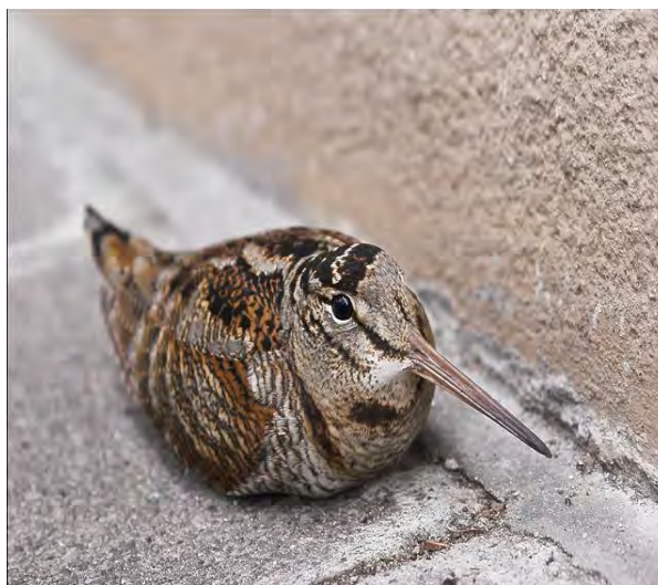
Фиг.3 Горски бекас ( Scolopax rusticola )

На територията на ДЛС “Черни Лом” е регистриран през гнездовия период в следните отдели: 30; 32а,б, г-з,л,м; 69а-г, е-о; 92г-к; 192б-з; 197а-л, н-с; 200; 304